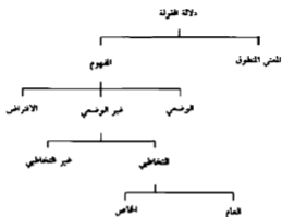
شكل (2) تنجيز صانك لتصنيف قرابيس للمعنى